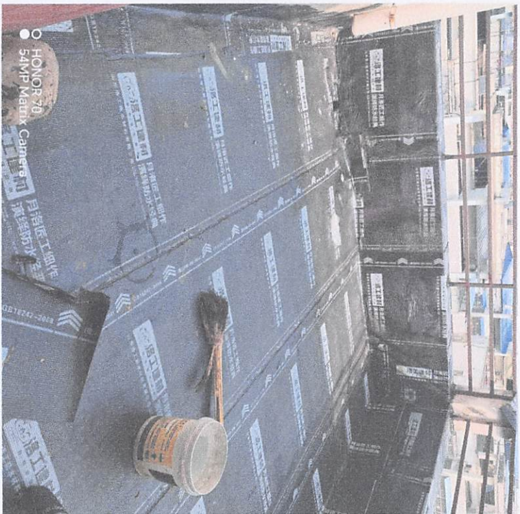
○ HONOR 70 54MP Matrix Camera