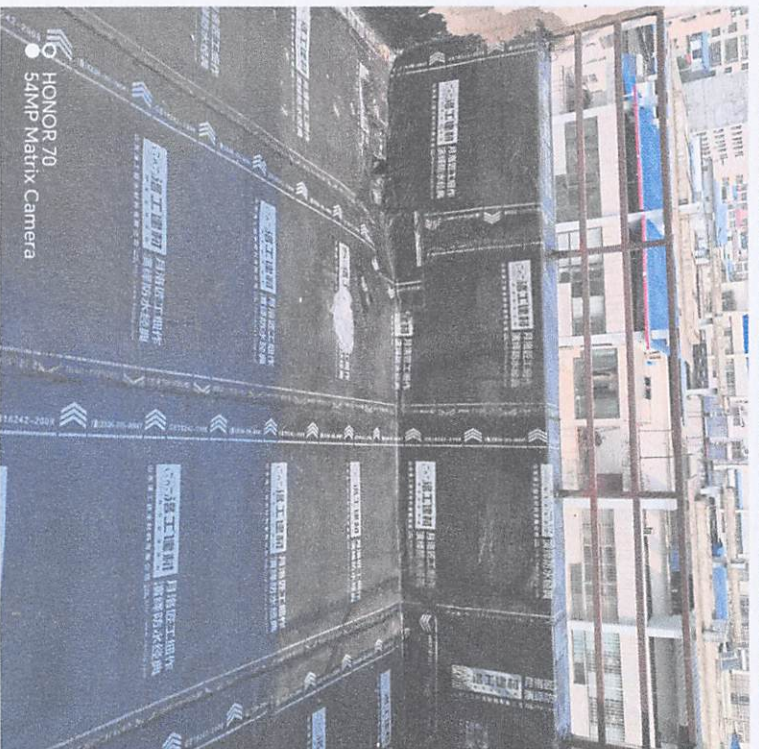
○ HONOR 70 54MP Matrix Camera