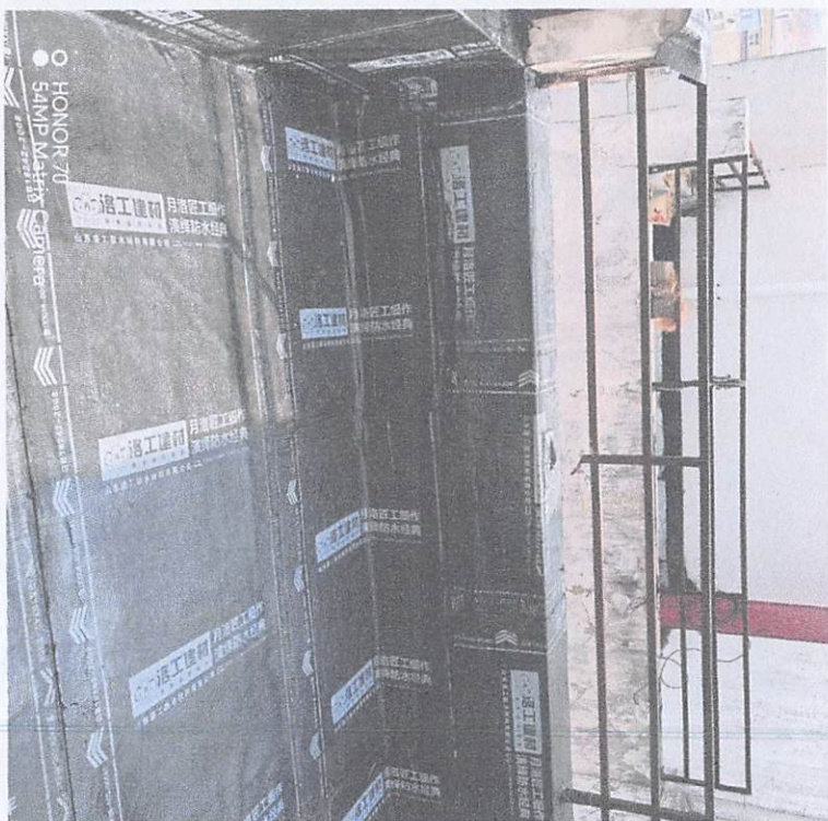
○ HONOR 70 54MP Matrix Camera