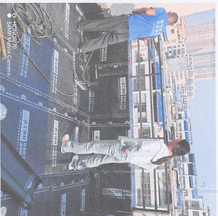
○ HONOR 70 54MP Matrix Camera