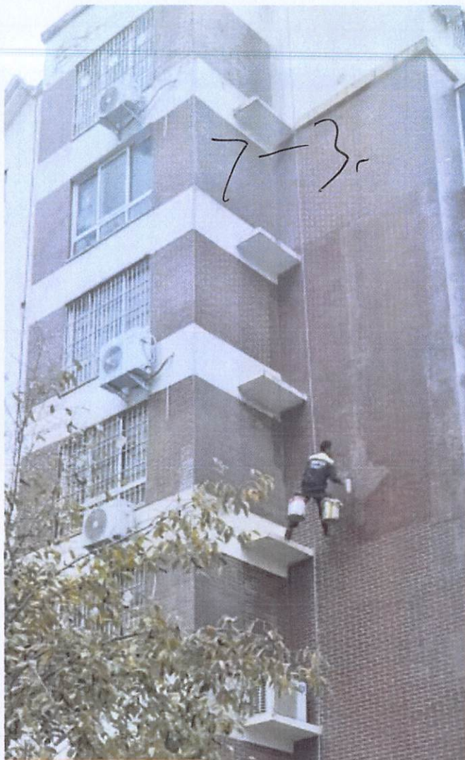
工作记录 房管人员维修万象城7#3 单元外墙维修中 24.11.12 15:54 唐河县·万象城 112.844210°E 32.674742°N