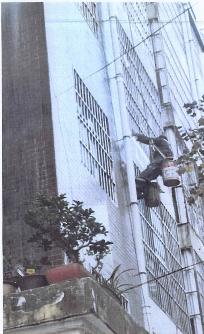
工作记录 工作内容: 房管人员维修万象城7#3 单元外墙维修中 拍摄时间: 2024.11.12 08:58 地点: 唐河县·万象城 经度: 112.844111°E 纬度: 32.674829°N