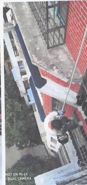
SHOT ON MI 6X MI DUAL CAMERA