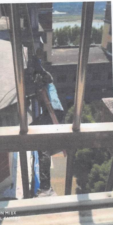
SHOT ON MI 6X MI DUAL CAMERA