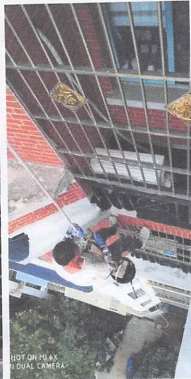
SHOT ON MI 6X MI DUAL CAMERA