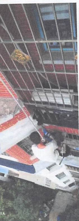
SHOT ON MI 6X MI DUAL CAMERA