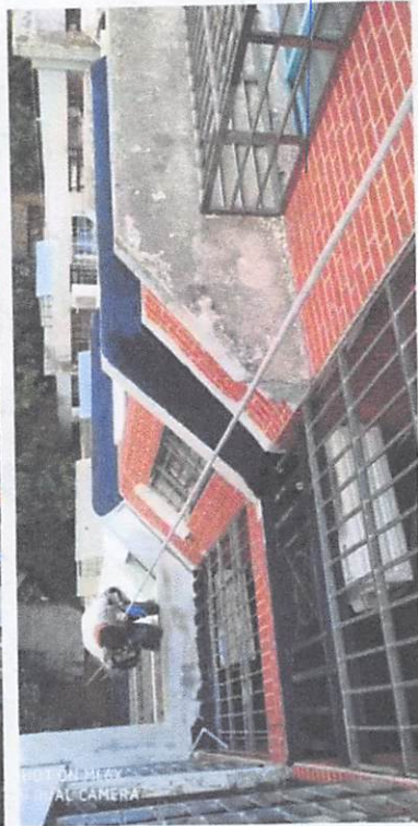
SHOT ON MI 6X MI DUAL CAMERA