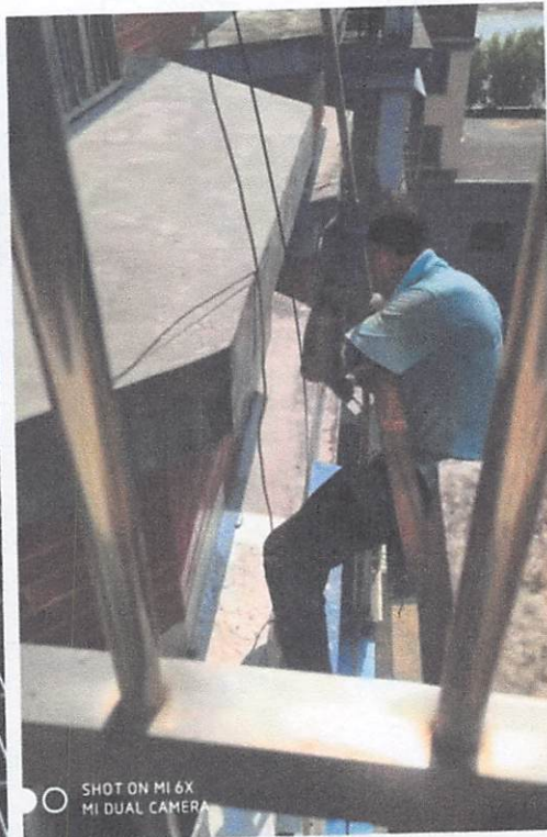
SHOT ON MI 6X MI DUAL CAMERA