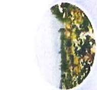
前庄民俗文化村寨