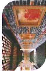
王庄民俗文化公园