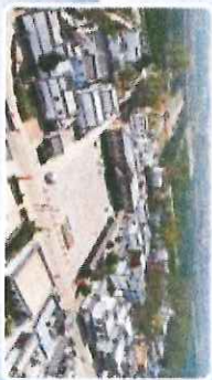
王庄 王超 村

唐河县滨河街道王庄村主动融入特色小镇和凤凰岭田园综合体规划格局，打造了春季“十里油菜花画廊”、秋季“十里谷子寨”、徽派特色建筑群、研学写生基地、乡村湿地游园、剪纸坊，全面促进了“文化+旅游、农业+旅游、研学+旅游”等产业融合发展，致力打造了“梦里王庄”文化旅游新品牌。