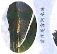
前庄民俗文化村寨