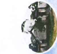
前庄民俗文化村寨

前庄村位于豫鄂两省交界处，是一个自然风光优美、历史文化悠久、生态环境良好的文化旅游胜地。依托石柱山、龙窝河、长征文化、古村落、古村落等资源，大力发展山水生态旅游，先后获得了“国家传统村落”、“全国一村一品示范村镇”、“南阳市乡村旅游特色村”等荣誉。在这里，游客进农家、寻乡愁、品古韵、赏风情，返朴还淳，尽享田园之乐。