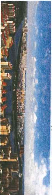
唐河画廊 李有庆 渠