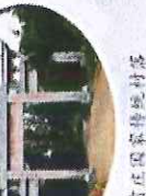
前庄民俗文化村寨