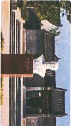
唐河冯友兰纪念馆