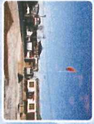
王庄 王超 村