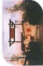
王庄民俗文化公园