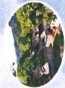
前庄民俗文化村寨