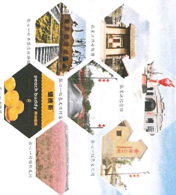
张心一村革命纪念馆

张心一村是原鄂豫边省委书记张星江烈士故里，也是半店镇万南镇镇基地核心村。张心一村充分发挥自身优势，深入挖掘红色资源，将红色基因和特色产业资源相整合，打造红色教育基地、张星江纪念馆和故居、中原传统村落、民俗农耕文化、景观水系和万亩油桐棋产业基地等项目，成为唐河县大别山革命老区红旅、文旅、农旅等多业态融合发展的乡村振兴典范。